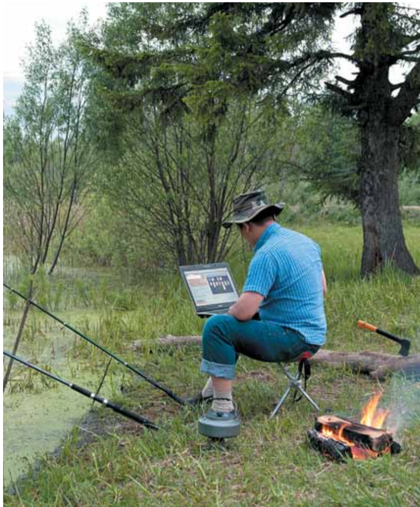
Деловые люди знают цену каждой минуты. Но летом даже финансы едут в отпуск... Стр. 8